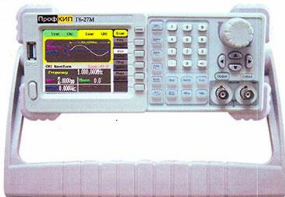
Рисунок 1 – Общий вид генератора

Генераторы представляют собой лабораторные многофункциональные измерительные приборы, принцип действия которых основан на технологии прямого цифрового синтеза, который позволяет получать стабильные, высокоточные сигналы с низким коэффициентом нелинейных искажений практически любой формы. На передней панели генератора находится цветной жидкокристаллический дисплей, состоящий из двух частей: в верхнем окне отображается форма генерируемого сигнала, в нижнем окне – его параметры. Справа от дисплея находится вертикальный ряд кнопок меню, с помощью которых пользователь может ввести меню различных генерируемых функций, и ряд кнопок, используемых при генерации стандартных форм сигналов. В нижней части панели расположены выходные разъемы двух каналов и кнопки, используемые при выборе функций модуляции. Для ввода цифровых параметров на панели имеется три группы органов управления: кнопки направлений (со стрелками), вращающийся регулятор параметров и цифровая клавиатура.