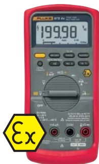
Fluke 87V Ex