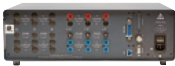
Fluke Norma 5000 (вид сзади)