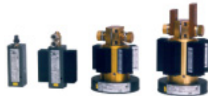
Дополнительные шунты для анализаторов электроснабжения Fluke Norma

Входные модули способны измерять токи до 10 A или 20 A напрямую или через широкополосные прецизионные шунты. Предлагается широкий выбор шунтов для измерения токов до 1500 A с возможностью их применения со всеми имеющимися входными модулями.