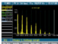
Анализ частотного спектра с применением быстрого преобразования Фурье (FFT)