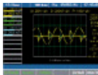
Цифровой осциллограф (DSO)