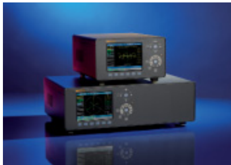
Анализаторы электроснабжения Fluke Norma 4000/5000