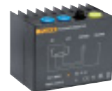
Планарный шунт для тока 32 A