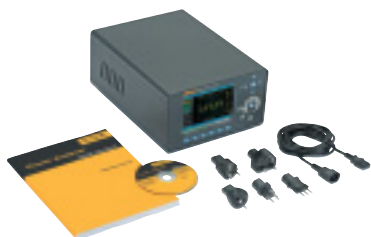
Fluke Norma 4000