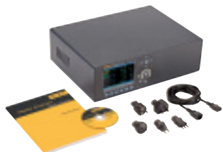
Fluke Norma 5000