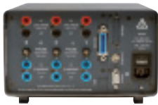
Fluke Norma 4000 (вид сзади)